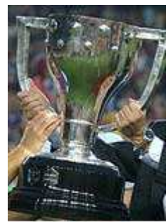
Los bancos más activos de España

Las compras de los private equity alcanzaron los 112.100 millones de dólares, un 44% que entre enero y marzo de 2005. Entre sus operaciones más importantes destacaron la compra de Alberston y la adquisición por en consorcio con Sofbank del negocio de telefonía móvil de Vodafone en Japón.